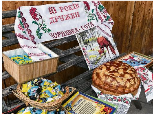
Das Büfett zur Feier des 10-jährigen Bestehens der Partnerschaft und Freundschaft zwischen dem ukrainischen Chorniavka und dem thüringischen Gotha ist angerichtet.