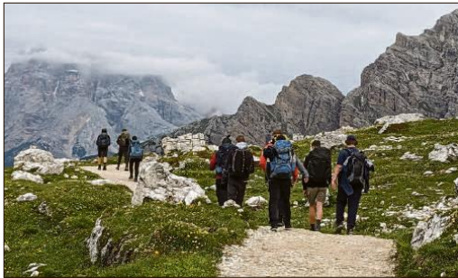
Berge bezwingen die Schülerinnen und Schüler bei Fahrten ebenso wie im übertragenen Sinn im Klassenraum.

All das ist in Vorbereitung und Durchführung anspruchsvoll für alle Beteiligten. Es sind eben keine Reisen »von der Stange«, sondern mit Herzblut organisierte Fahrten, die trotz aller Planung viel Unvorhersehbares bereithalten, wie die spontane Hilfe von Dorfbewohnern, die selbst organisierte Hilfe bei einer Fahrradpanne oder das Erlebnis, dass der viel zu schwere Rucksack eines Kindes ganz selbstverständlich aufgeteilt und der Inhalt von vielen getragen wird. Zu