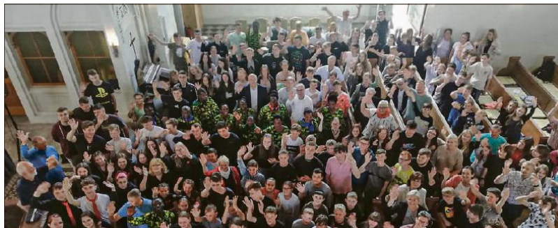
Gottesdienst in St. Petri Großmühlingen: Die Christliche Sekundarschule Gnadau mit den Standorten Barby und Großmühlingen feierte ihn voriges Jahr gemeinsam mit der Partnergemeinde aus Tansania.

Ein wesentlicher Pfeiler evangelischer Schulgemeinschaft ist das christliche Profil, welches den Schulalltag maßgeblich mitbestimmt. Dem Wunsch der Eltern nach christlicher Werteorientierung für ihre Kinder kommen die Lehrkräfte im alltäglichen Umgang miteinander, mit Kindern und Eltern nach. Zusätzlich lernen die Kinder durch unterschiedliche Formate ganz selbstverständlich Kirche und liturgische Abläufe kennen und wertschätzen. Von kleineren Andachten über themenbezogene Gottesdienste und die Einsegnung neuer Lehrkräfte bis hin zu Segensfeiern reicht das Spektrum des evangelischen Profils im Schulalltag.