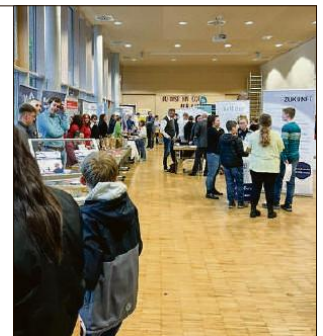
Auf der Berufsmesse lernten die Jugendlichen Ausbildungsmöglichkeiten in ihrer Region kennen.

Wir als Evangelisches Schulzentrum hoffen, unseren Schülerinnen und Schülern mit diesem Projekt bei der Suche nach ihrem Traumberuf zu helfen und ihnen konkrete Perspektiven für die Zukunft aufzuzeigen. Seit Februar läuft nun der »Tag in der Praxis« an unserer Schule, und viele Schüler und Schülerinnen äußerten sich in den ersten Feedbackgesprächen im BO-Unterricht sehr positiv.